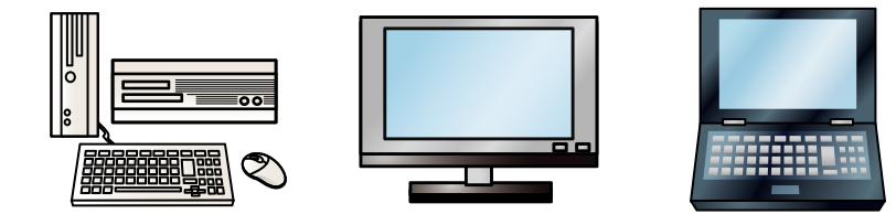
デスクトップパソコン本体