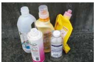
▲ペットボトル以外のものを混ぜないでください