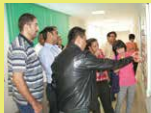
▲工場内の視察の様子