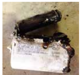
▲ごみの中から見つけた充電電池