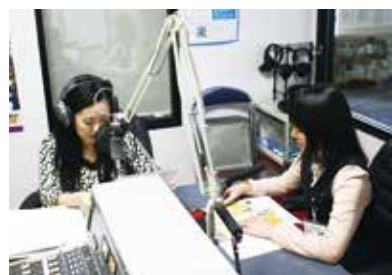
▲対話形式で楽しくお伝えします

パーソナリティーで、広報紙の内容についてお伝えしていきます。広報紙では伝えきれなかったことや、環境に関する話題など内容は盛りだくさん。ぜひ一度、FMうじ(88.8MHz)に周波数を合わせてみてください。*当組合ホームページからも聴くことができます。