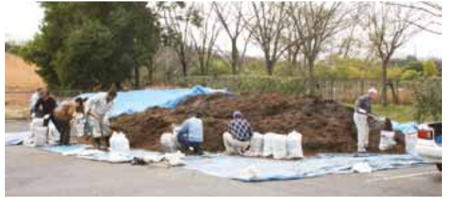
▲毎回たくさんの方に利用いただいています