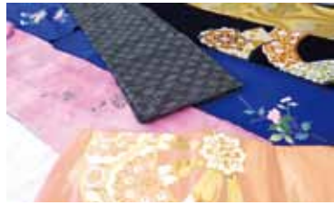
▲大島紬など様々な着物を展示します