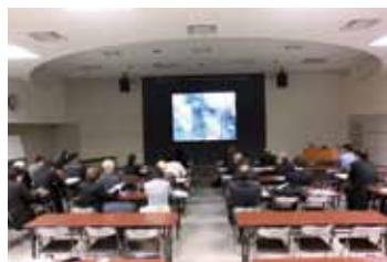
▲新日鐵住金での視察風景