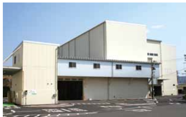
▲クリーン21長谷山の隣に建設されたリサイクルセンター長谷山

奥山リユースセンターの老朽化に伴い建設された新施設「リサイクルセンター長谷山」が、試運転の期間を終え、4月から本格稼働を開始しました。ここでは、不燃・粗大ごみの処理とプラスチック製容器包装の資源化を行います。