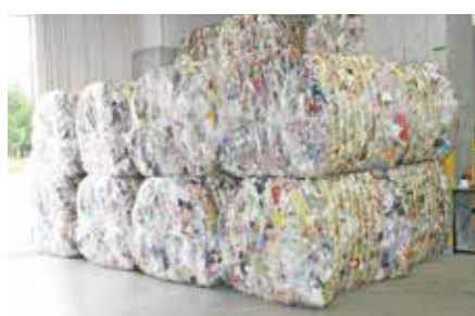
▲圧縮・梱包されたプラスチック製容器包装。1つのかたまりで約250kgの重さがあります。

選別作業を終えたプラスチック製容器包装は、機械で圧縮・梱包し、日本容器包装リサイクル協会に引き渡します。この後プラスチックは、新たなプラスチック製品に生まれ変わるほか、化学原料として使われたり、石炭の代わりとして、鉄を作る時の還元剤に使われたりします。こうして、プラスチック製容器包装をリサイクルすることにより、これまで埋立地に埋めていたプラスチック類が減り、埋立地の延命化が図れると同時に、限りある資源も有効に活用できることとなります。リサイクルを進めるためには、住民の皆さんの分別が欠かせません。