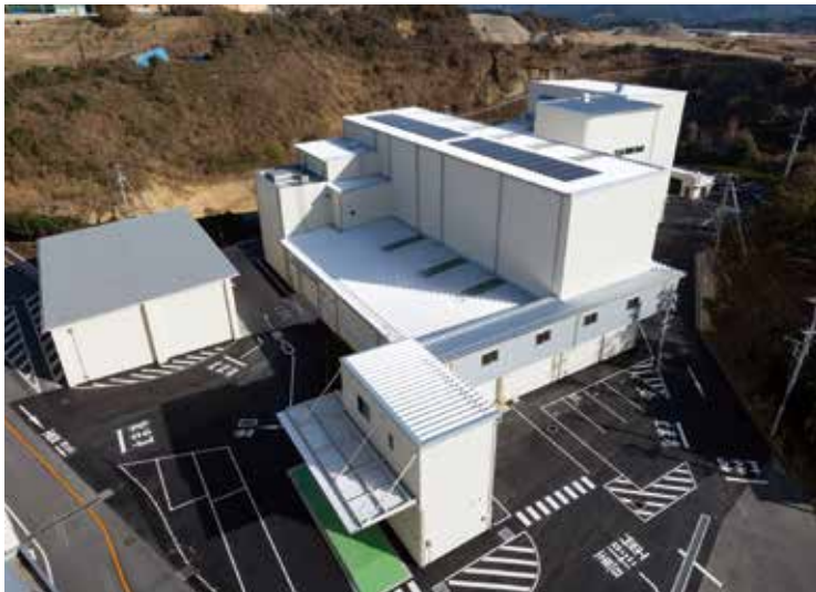
▲リサイクルセンター長谷山の屋根には太陽光パネルがついていて、発電した電気は電力会社に売っています。

*パソコンで「声のエコネット城南」(声の広報)を聴くことができます。詳しくは組合ホームページをご覧ください