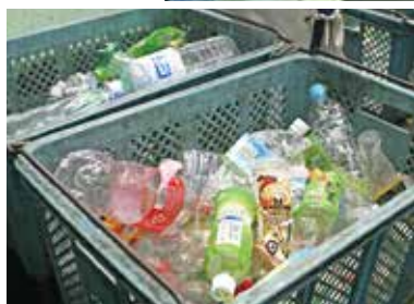
▲キャップ付きのペットボトルですぐにいっぱいになります

また、ボトルにキャップがついていると、中に飲み残しやごみが入っている可能性も高くなり、においの原因になったり、リサイクルができなくなったりします。