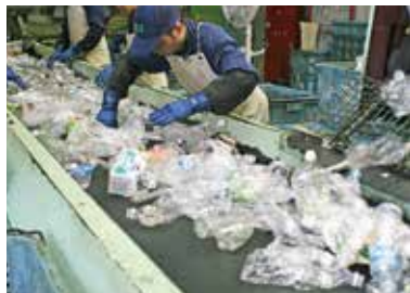
▶手選別コンベアで作業をする様子

夏になると、エコ・ポート長谷山に運ばれてくる飲み物の容器も増えます。その中でも、ペットボトルの量は多く、一番搬入量の少ない月と比べると、約2倍の量が運ばれてきます。ペットボトルは工場に運ばれた後、手作業で異物を取り除く選別作業を行いますが、この時期には、量が多くなる分、作業も大変になってきます。