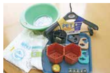
▲様々なプラスチック製品や衣類などに生まれ変わります

この後フレークは、国内成型メーカーに引き渡され、繊維や成型品を作る原料として使われます。当組合から搬入されるペットボトルは異物の混入もなく、きれいなため、処理工程としては、破碎機に投入しフレークにするだけで出荷しているそうです。 リサイクルを進めるため、皆さんの適正排出について引き続きご協力をお願いいたします。