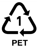
▲ペットボトルの識別表示

違うため、一緒にリサイクルすることができません。ペットボトルを出す際には、本体に表示されているマークを確認してください。