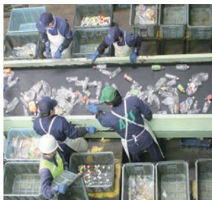
▲手選別作業の様子

夏期は搬入量が特に多くなりますので皆様のご協力をお願いします。 ※簡単にはがすことができないラベルはそのまま出してください。