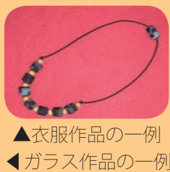
▲衣服作品の一例 ▲ガラス作品の一例