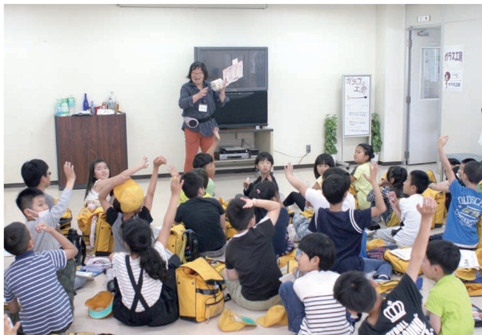
ガイドスタッフの質問に答える時にも元気いっぱいです