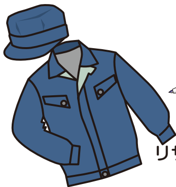
リサイクルされた製品の一例