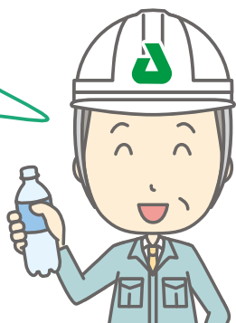
エコ・ポート長谷山職員の話

約25kgのベール(かたまり)が120個で、500mlのペットボトルに換算すると 約12万本 のペットボトルとなります。