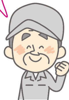
再生工場の方のお話