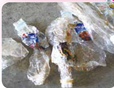
◀中身が残っているペットボトル