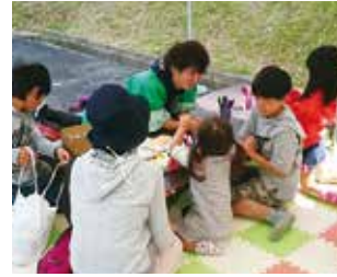
▲こどものあそびばコーナーの様子

10月14日(日)に当組合長谷山エリアにて環境まつりを開催しました。今年4月に竣工・稼働したクリーンパーク折居等のごみ処理施設の見学ツアー、フリーマーケット、無料のリサイクル作品作りなど、様々な催しを行い、約1,300人の方にご来場いただきました。