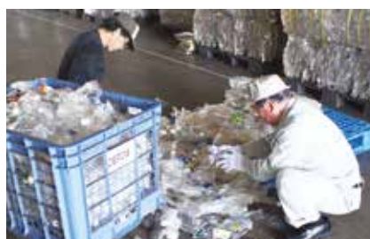
▲品質調査の様子(圧縮されたものを分解して不適物を手選別しています)