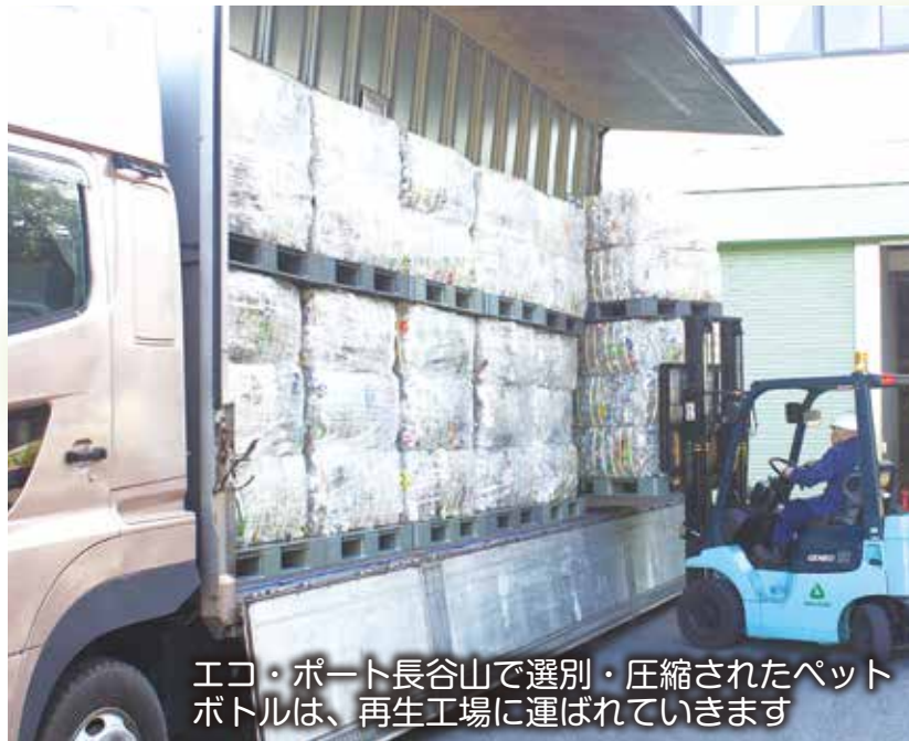
エコ・ポート長谷山で選別・圧縮されたペットボトルは、再生工場に運ばれていきます

城南衛生管理組合は宇治市・城陽市・八幡市・久御山町・宇治田原町・井手町が環境廃棄物行政を推進するための特別地方公共団体(一部事務組合)です。