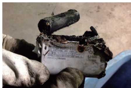
▲焼け焦げた充電電池

充電電池が危険なわけ 粗破砕機(イラストの②)は金属の刃を回転させて、ごみを砕いています。充電電池が破砕される際の発熱で小火(ぼや)が起こってしまいます。