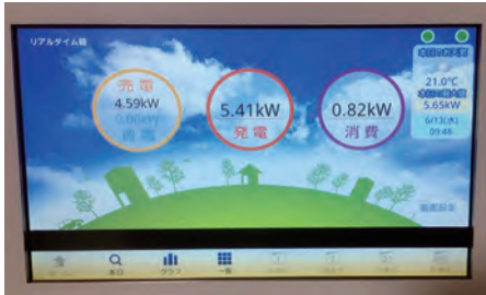
▲現在は5.41kWで発電中です

「現在は、〇kW(キロワット)発電しています」とありますが、実際にはどれくらいの電力なのでしょう。そこで今回は、管内のあるお宅に伺いました。下は実際に使用して