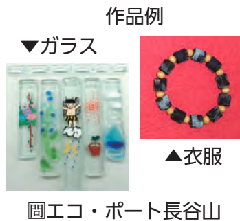
園エコ・ポート長谷山

エコ・ポート長谷山では、管内小学校(4年生以上)や自治会等への出前講座を実施しています。この講座では、ガラスや衣服のリサイクル作品作りが体験できます。お気軽にお問い合わせください。