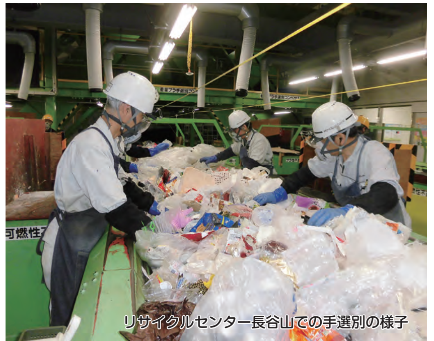
リサイクルセンター長谷山での手選別の様子

そこで今回は、この3年間におけるプラスチック製容器包装のリサイクル状況をお知らせします。