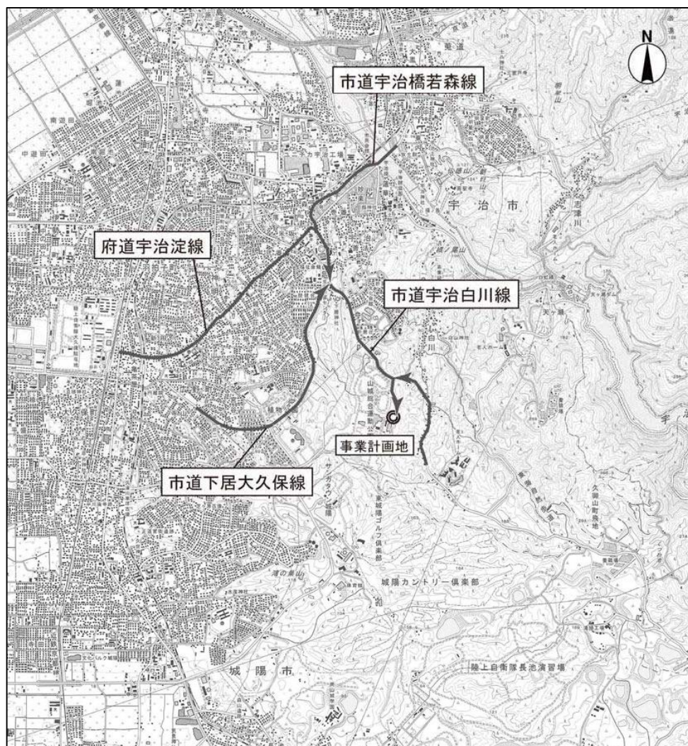
図 主要搬入ルート

主要搬入ルートは従来どおりとする（府道宇治淀線、市道下居大久保線または市道宇治橋若森線から宇治市役所前、山城総合運動公園前を経由する主要搬入ルートにより更新施設へ搬入する。 下図 参照）。