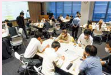
▲学生との意見交換ワークショップ