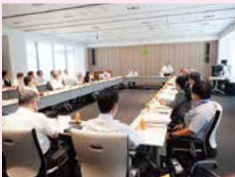
▲第1回循環型社会推進会議