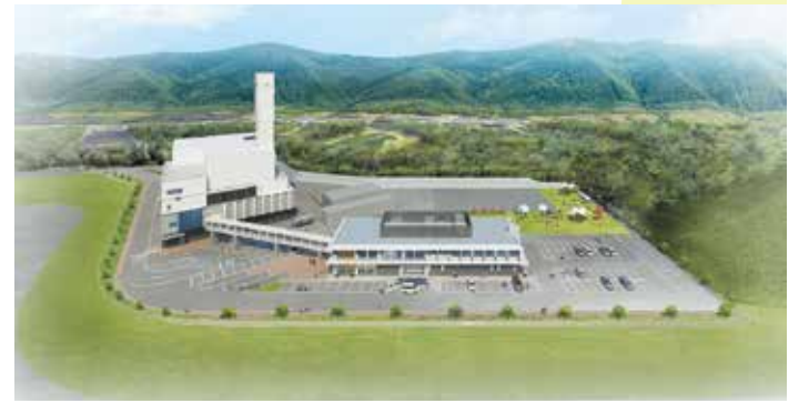
▲新事務所棟及びクリーンパーク折居の外観(イメージ)

環境ふれあいひろばは、7月16日に供用開始予定の新事務所棟の1階に開設予定です。これまでエコ・ポート長谷山で行ってきたリサイクル工房に加え、リユースコーナーや展示物、ワークショップの開催等の楽しみながら学べるコンテンツを提供します。