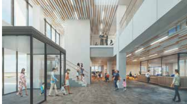
▲エントランス(イメージ)

連絡通路を利用して隣接するクリーンパーク折居(ごみ焼却施設)を気軽に見学することができます。