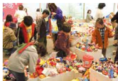
▲かえっこバザール(イメージ)

ご家庭で使わなくなったおもちゃをお持ちください。 (ノベルティ及びゲームソフトを除く) お持ちいただくと、ポイントを付与し、お持ちのポイントに応じ、 各種おもちゃと交換できます。 また、動かなくなったおもちゃは診療所で修理します。