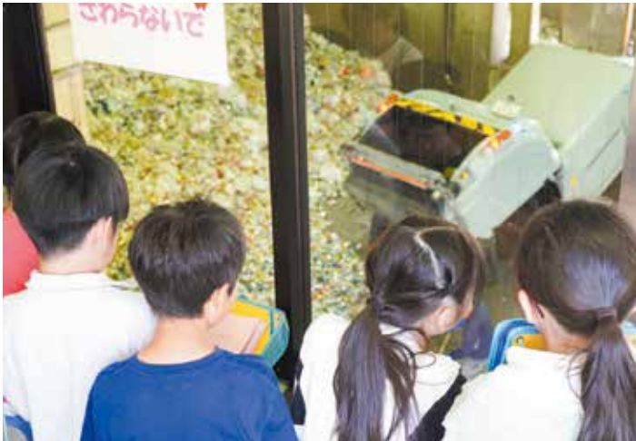
▲プラットホームにごみが搬入される様子を見学する子どもたち