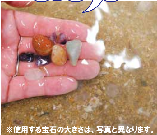
※使用する宝石の大きさは、写真と異なります。