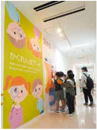
▲かくれんぼアート