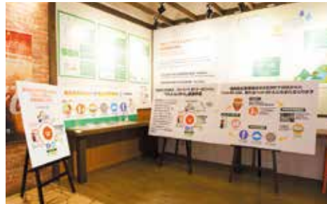
▲コカ・コーラ京都工場のブース

8月6日(火)には、最新のペットボトルリサイクルが学べる講座と、クリーンパーク折居の施設見学会も開催します。(下記参照)ぜひご参加ください。