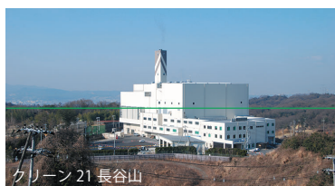
クリーン 21 長谷山

本施設の長期的な稼働に向けて、燃焼設備等の基幹的な設備を整備・更新し、最大限の長寿命化を図ります。